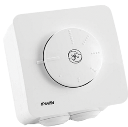
RN, RNT otočný regulátor otáček