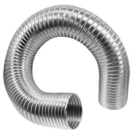
KLIMAFLEX ohybné hliníkové potrubí