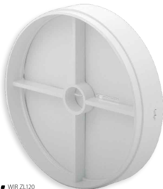
■ WIR ZL120