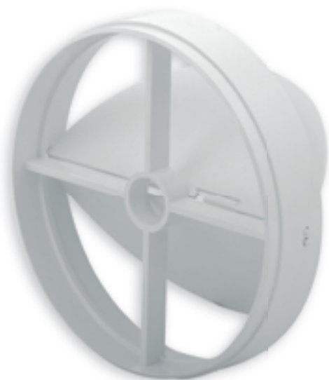
■ WIR ZL100

Przepustnica samoczynna Zapětná klapka Spätná klapka