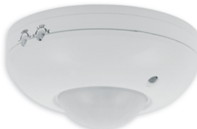
■ ZONA JQ-37-W